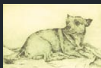
Kaspar • 2006