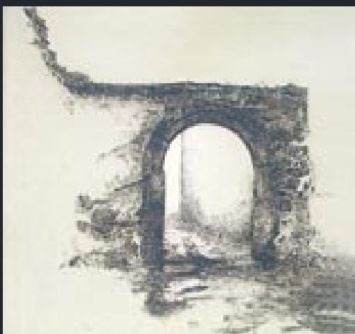
Regenbogen • 2002

„Ich radiere, was ich sehe oder vielmehr was ich denke, was ich sehen sollte durch Geist, Auge und Hand gefiltert, gespiegelt und geformt, in niemandes Auftrag als dem Innewohnenden. Staunen und Sehnsucht muß immer im Spiel sein. Im Winter radiere ich den Sommer, im Gebirge das Meer ... Das Bemühen gilt immer dem ‚Inbild‘ statt dem ‚Abbild‘.“