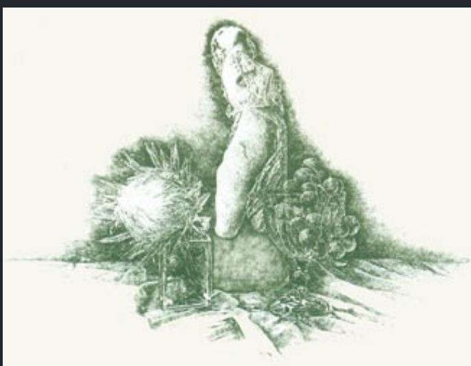
Stilleben m. Mänade • 2001

Arbeiten im Besitz zahlreicher Museen und Sammlungen u.a. in Altenburg, Berlin, Cottbus, Dresden, Frankfurt/Oder, Gera, Göttingen, Halle, Leipzig, Lübeck, Marbach, Oberhausen, Oslo, Rostock, Schwerin, Stuttgart und Zürich